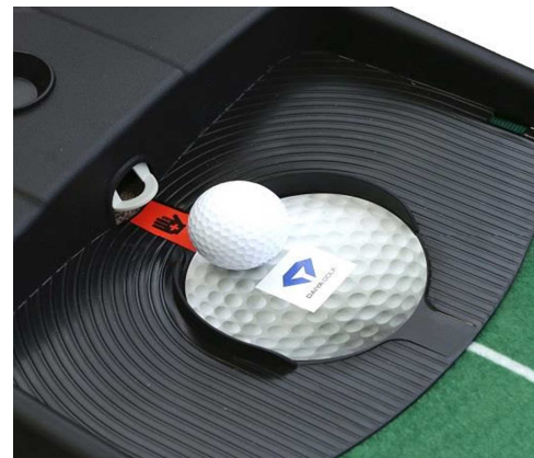
【電動オートリターンスイッチ部】

※オートリターン機能付き当社従来品比較。TR-522 本体価格 18,000 円 (税抜)