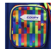
パッケージのような ポケット